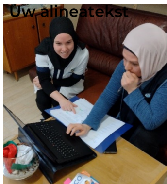
De ESF-mentor geeft extra uitleg bij het maken van de opdrachten.